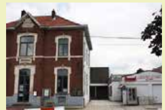
OC Oud Gemeentehuis Gemeentehuisstraat 11 3078 Everberg