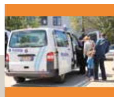
Opendeurdag politie HerKo op 29 mei