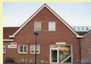
OC De Zolder Kwerpsebaan 251 3071 Erps-Kwerps