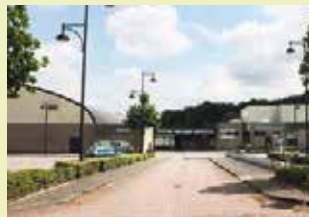
Sporthal en GC Colomba Wijngaardstraat 1 3070 Kortenberg