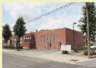
OC Berkenhof Beekstraat 25 3070 Kortenberg