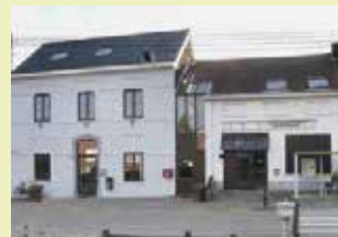
OC Atrium Dorpsstraat 177 3078 Meerbeek