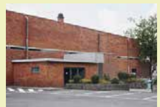
Polyvalente zaal Erps-Kwerps Oude Baan 14 3071 Erps-Kwerps