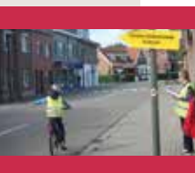
Opgelet: levend verkeerspark in Kortenbergse straten!