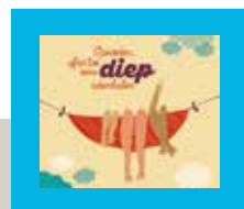
Week van de Opvoeding van 16 tot 23 mei