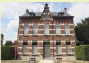
Erfgoedhuis Dorpsplein 16 3071 Erps-Kwerps