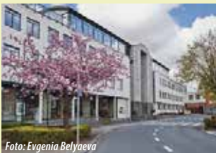
Administratief Centrum Dr. V. De Walsplein 30 3070 Kortenberg